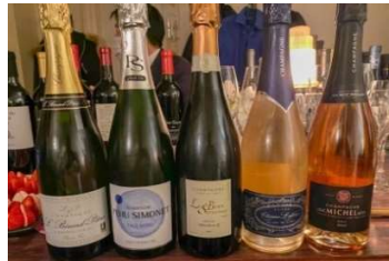
▲7種類8産地の苺とシャンパンのマリアージュを体感し、食と会話を楽しむイベントとなった。